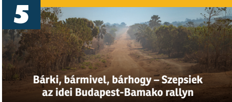
Bárki, bármivel, bárhogy – Szepsiek az idei Budapest-Bamako rallyn