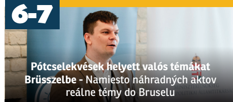
Pótcselekvések helyett valós témákat Brüsszelbe - Namiesto náhradných aktov reálne témy do Bruselu