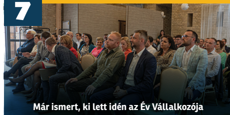
Már ismert, ki lett idén az Év Vállalkozója