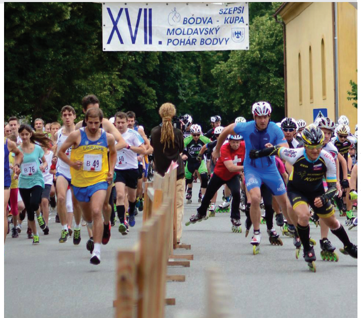
Fotó: Szepsi Bódva kupa

1. Júla sa opäť uskutoční Moldavský pohár Bodvy, na ktorom si zmerajú sily stovky bežcov, cyklistov, ako aj korčuliarov na kolieskových korčuľiach. Do 26. júna je možné sa registrovať za výhodnejšiu cenu – štartovné je 20 eur na osobu. Pretekov sa môžu zúčastniť aj tí, ktorí zmeškajú online registráciu. Registrácia na mieste bude možná od 7.00 do 8.30 v deň pretekov a štartovné bude stáť 30 eur. Všetky potrebné informácie nájdete na internetovej stránke www.bodvakupa.sk .