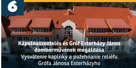
Kápolnaszentelés és Gróf Esterházy János domborművének megáldása Vysvätenie kaplnky a požehnanie reliéfu Grófa Jánoša Esterházyho