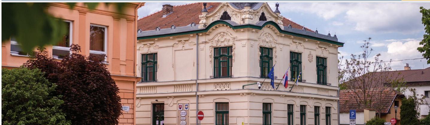
Fotó: Bartók Csongor